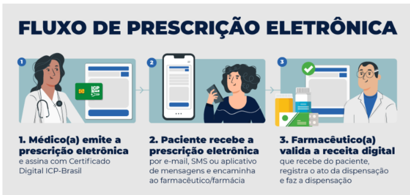
Imagem 1. Fluxo de Prescrição Eletrônica (ITI)