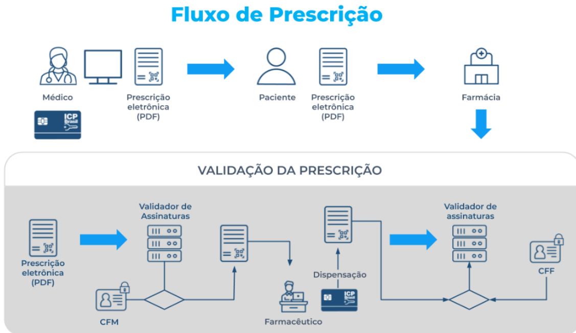
Imagem 3. Fluxo de Prescrição Eletrônica (ITI)