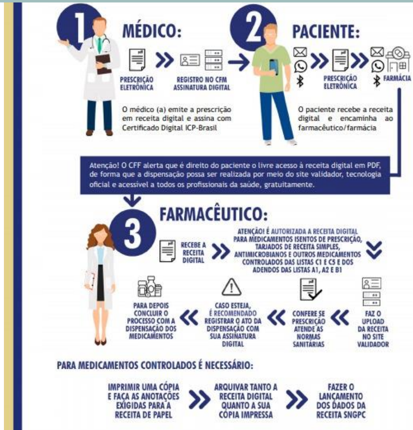
Imagem 2. Manual Entenda a dispensação na telemedicina (CFF)